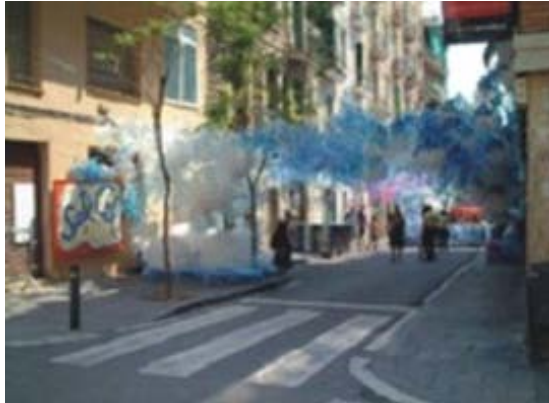
Figura 3. Adorno de c/ Joan Blanques (2002).