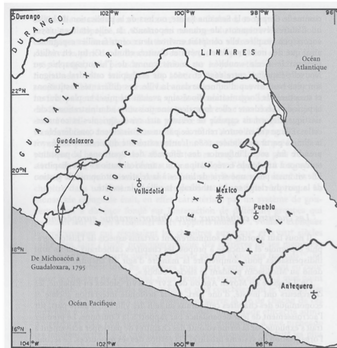
Mapa 1: Límites diocesanos de Nueva España. 17

De la consolidación de las sedes diocesanas en las Indias, el rasgo acaso más sobresaliente es el arraigo gradual del clero catedral y parroquial a su obispado respectivo. No sólo a causa del lugar de origen y extracción de sus miembros o de un promedio de residencia para los clérigos foráneos superior a los diez años. 18 En el caso de Michoacán también interviene un siglo de formación y reclutamiento de varias generaciones de eclesiásticos oriundos de las ciudades y villas de la provincia de Chichimecas, el futuro Bajío, porción media